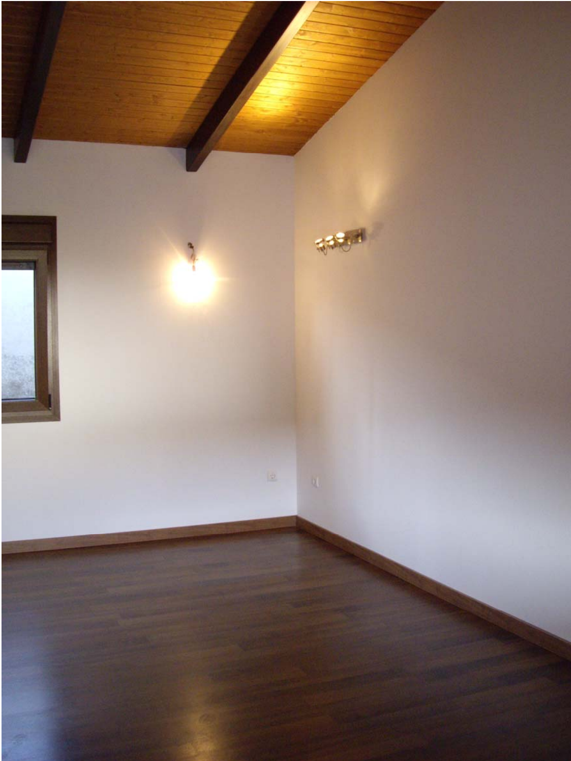
DETALLE INTERIOR SALÓN COMEDOR