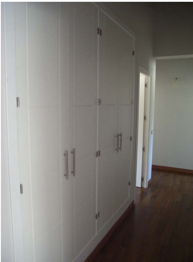
DETALLE ARMARIOS EMPOTRADOS