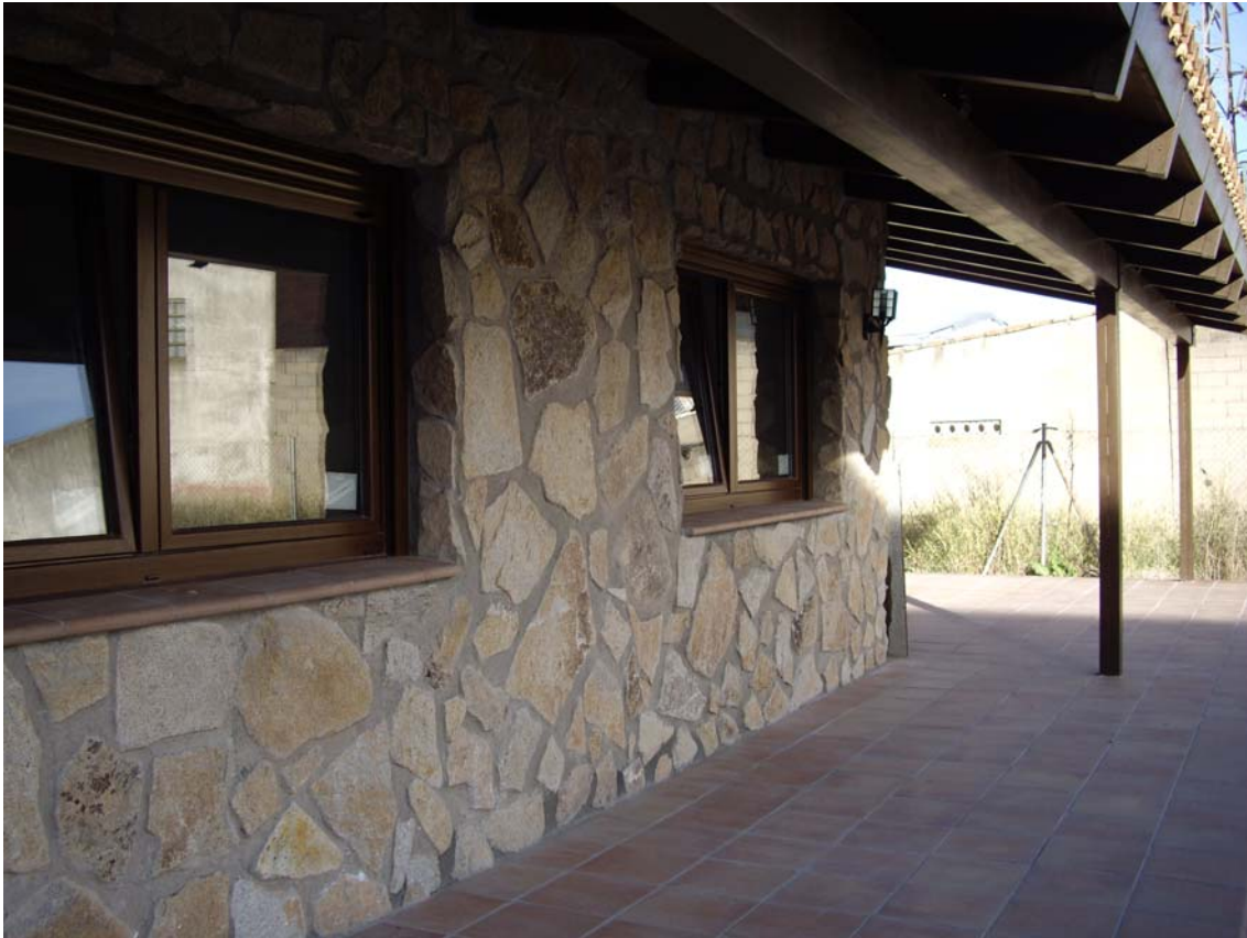
DETALLE ACABADOS DE PORCHE