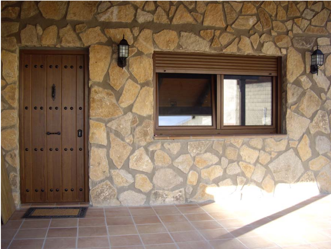
DETALLE ACCESO VIVIENDA DESDE PORCHE