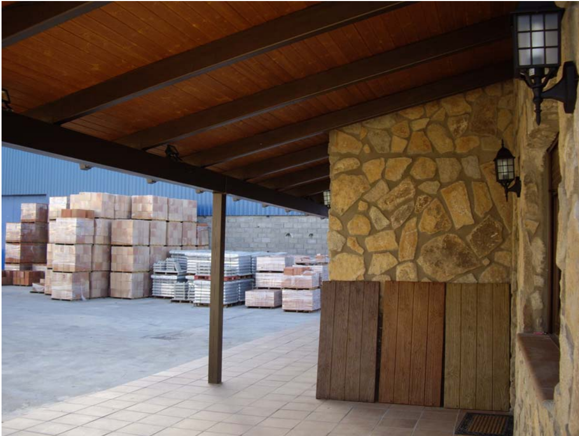
DETALLE PORCHE CUBIERTO