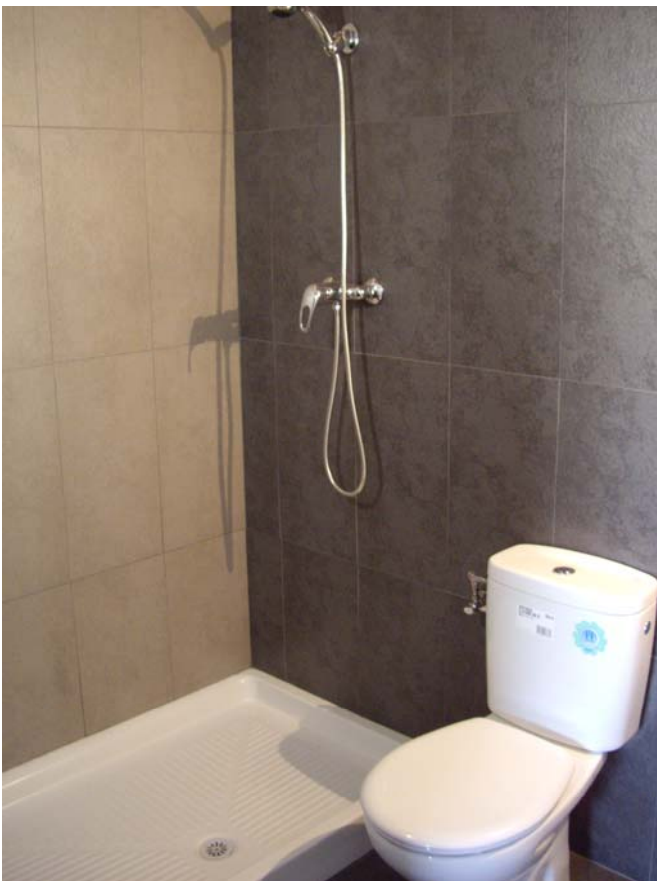
DETALLE BAÑO EQUIPADO